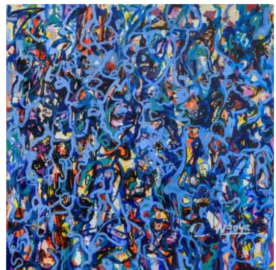
Abb.: Galerie Melbye-Konan, Ngoye, Untitled, Öl- und Papiercollage auf Leinwand, 2023, 150 x 150 cm

Die Galerie Melbye-Konan vertritt international etablierte und aufstrebende zeitgenössische Künstler aus Europa, den USA und Afrika. Auf 400 Quadratmetern präsentiert die Galerie ein dynamisches und visionäres Ausstellungsprogramm auf Museumsniveau. Internationale Sammler und Kuratoren schätzen die Expertise der Kunsthistorikerin Stella Melbye-Konan für zeitgenössische Kunst. Anlässlich des Galerierundgangs lädt die Galerie am Abend des 6. Oktober zur Vernissage der Einzel-ausstellung des Künstlers Ngoye ein.