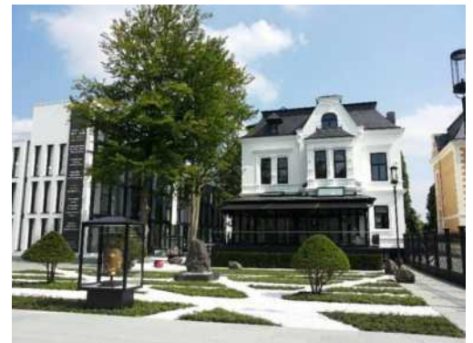
Abb.: Galerie Mikado Asiatica, Außenansicht

Die Mikado Asiatica Galerie am Mittelweg 111 ist spezialisiert auf asiatische Kunstschatze. Auf vier Etagen wird ein einmaliges Angebot an Skulpturen aus verschiedenen fernöstlichen Ländern präsentiert. Unsere Galerie umfasst eine der größten Buddha-Sammlungen Deutschlands.