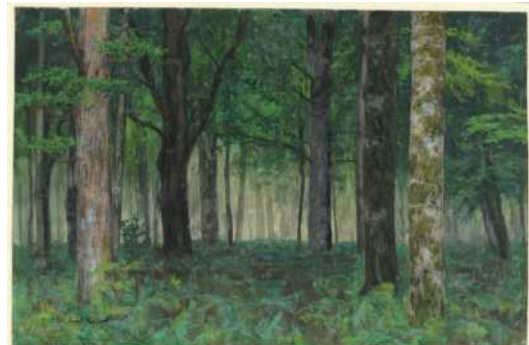
Abb.: Dr. Moeller & Cie, Walter Leistikow, Bromberg 1865 - 1908 Berlin), Wald bei Friedrichsruh, um 1895, Aquarell und Gouache auf Papier, signiert, 31,3 x 47,8 cm

Seit über 25 Jahren hat sich die Galerie Dr. Moeller & Cie. auf Handzeichnungen und Aquarelle spezialisiert. Das Angebot umfaßt die weite Spanne der italienischen Altmeister, der holländischen, flämischen und vor allem französischen Schulen des 17. bis 19. Jahrhunderts sowie der deutschen Handzeichnung von der Romantik bis hin zur klassischen Moderne Mitte des 20. Jahrhunderts. Umfangreiche Kataloge begleiten die regelmäßigen Ausstellungen in Hamburg sowie die Präsentationen auf internationalen Kunstmessen.