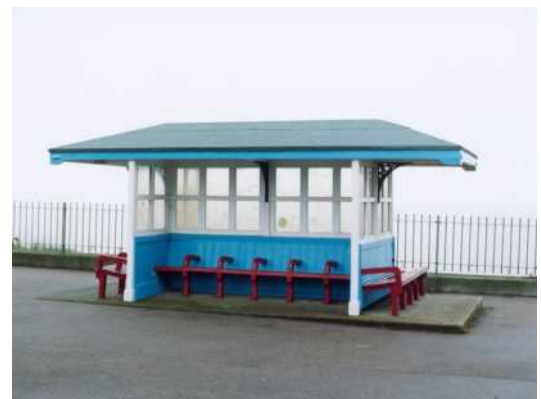
Abb.: Götz Diergarten, „o.T. (Broadstairs – Eastern Esplanade)“, 2003 C-Print / Diasec, 2006. Edition 1/5.

Die Kunstagentur Marcard Pro Arte wurde 1998 von Mathias v. Marcard gegründet. Von Haus aus eigentlich Investmentbanker, machte er seine Leidenschaft zum Beruf. Ursprünglich im Bereich des Kultursponsorings aktiv, spezialisierte er sich auf den Bereich Ausstellungsorganisation und Ausstellungskuration mit einem besonderen Fokus auf historische, moderne und zeitgenössische Fotografie. Außerdem ist v. Marcard im Bereich der Kunstberatung und Kunstvermittlung tätig.