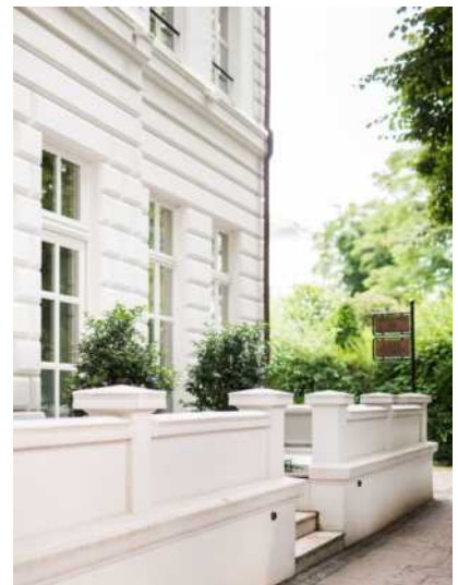
Abb.: KARL&FABER Kunstauktionen, Aussenansicht

Das traditionsreiche Münchner Auktionshaus, das in diesem Jahr sein 100-jähriges Bestehen feiert, ist seit fast 20 Jahren mit einer Repräsentanz in Hamburg vertreten. Seit 2016 hat die Niederlassung ihren Sitz in einer Gründerzeitvilla im Rotherbaum-Viertel und ist zu einem beliebten Treffpunkt für Kunstliebhaber und Sammler geworden. Sie beraten die Kunden beim Kauf und Verkauf von Kunstwerken von den Altmeistern bis zur Zeitgenössischen Kunst.