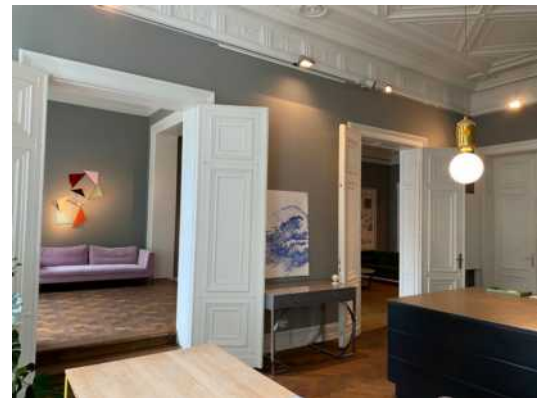
Abb.: JB FineArts, Innenansicht Räumlichkeiten