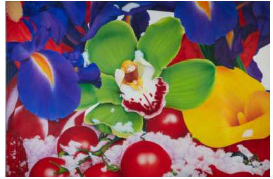
Abb.: Sotheby's, Marc Quinn (g. 1964), Upper stratospheric photochemistry , Öl auf Leinwand, 169 x 254 cm, Entstanden 2007, Schätzpreis: 50.000 – 70.000 €

Sotheby's ist weltweit die führende Adresse im Kauf und Verkauf von Kunst und Luxus. Das Auktionshaus zeigt in seiner Hamburger Repräsentanz am 6. Oktober 2023 im Rahmen von „Kunst am Rothenbaum“ eine kuratierte Auswahl der Auktion, die vom 14.-21. November 23 in Köln angeboten wird: „Modern and Contemporary Auction“.