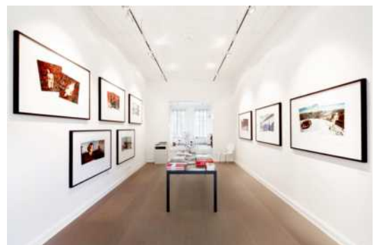
Abb.: Innenansicht Räumlichkeiten

In den hellen und modernen Räumen nahe der Alster werden in wechselnden Ausstellungen moderne und klassische Fotokunst präsentiert. Zudem findet sich eine große Auswahl an exklusiver Foto- und Lifestyle-Bücher. Herz und Kopf der Galerie ist Galeristin Kirsten Roschlaub hat ihre Passion zum Beruf gemacht. Im Herbst 2015 eröffnete sie die Galerie Roschlaub und den dazugehörigen Online-Shop.