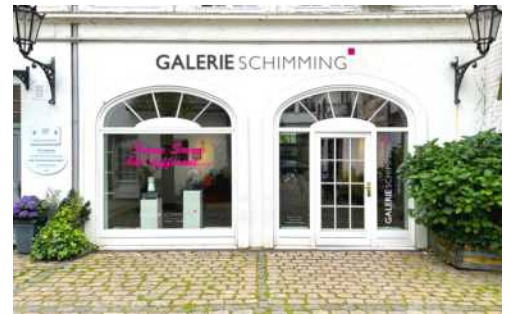
Abb.: Galerie Schimming, Aussenansicht

Gegründet im Jahr 2003, zeigt die Galerie Schimming in wechselnden Einzel- und Gruppenausstellungen, an zwei Standorten in Hamburg, verschiedene Positionen der modernen Gegenwartskunst und pflegt einen engen Kontakt zu einer kuratierten Auswahl aufstrebender sowie etablierter deutscher und internationaler Künstler. Schwerpunkt des Galerieprogramms sind Werke im Bereich der aktuellen Bildenden Kunst; von der Neuen Leipziger Schule bis hin zur Pop Art. Anlässlich des Galerierundgangs eröffnet die Galerie Schimming, unter Anwesenheit des Künstlers, eine Soloshow des Niederländischen Shootingstars RAIDER The Creator.